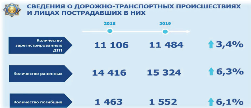
Рисунок - 3. [5]

Вышеприведенные утверждения подтверждаются статистическими данными.